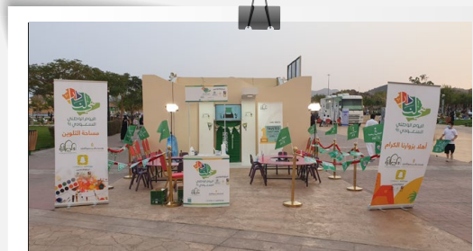
صور من برامج وأنشطة الجمعية